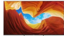
Pieds en position central